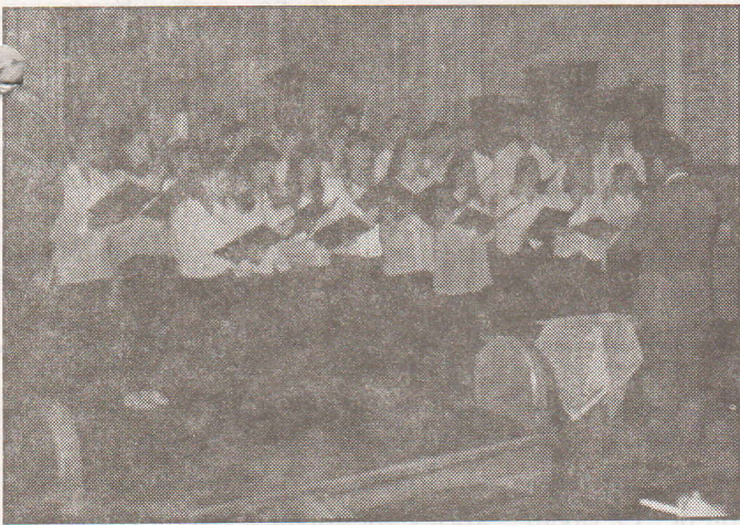
A munkácsi kórus

Június 12. és 17. között Kárpátalja római katolikus híveiből álló zarándokcsoport utazott Medugorjéba, arra a Mária-kegyhelyre, ahol a Szűzanya látnokokon keresztül még most is üzen a világnak, és békére, megújulásra szólít mindenkit. A zarándokok találkoztak a még életben lévő látnoknővel, aki imádkozott értük a kegyhelyen. Nagy élmény volt számukra a drogról lemondott fiatalokkal való találkozás is, melynek során megrendítő tanúságtételek hangzottak el.