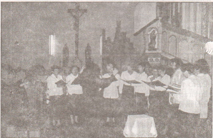
Az aknaszlatinai (fent) és a nagyszőlősi (lent) kórus.