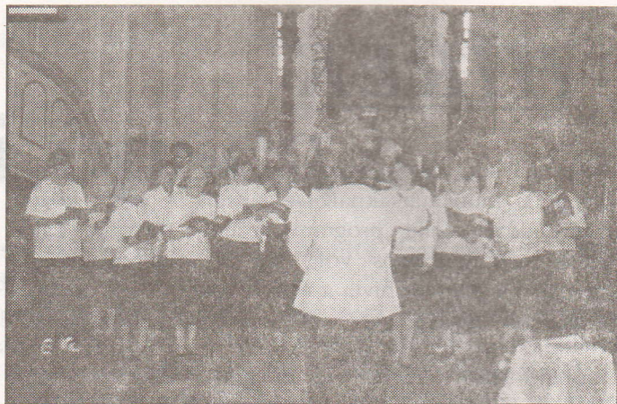
A buszti (fent) és az unguári (lent) kórus.