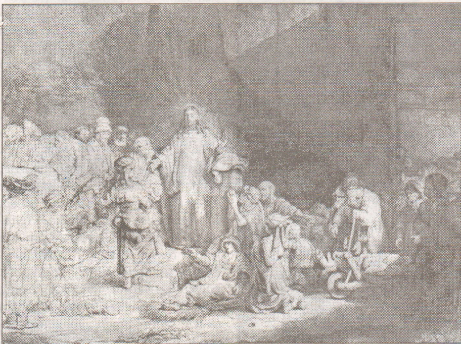
Rembrandt: Százforintos lap

Rembrandt, akárcsak Dürer a maga idejében, nemcsak festőnek volt igazán nagy: grafikusként is egyedülálló művész volt. A zsidó ne-