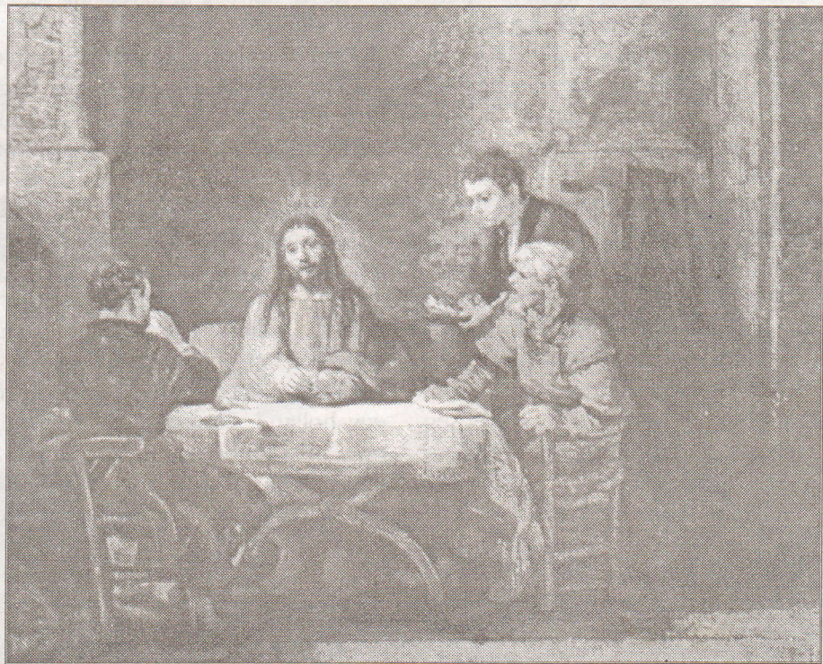
Rembrandt: Emmausi vacsora

Leydenben, a holland egyetemi városban született. Apja jómódú molnár volt. A fiatal Rembrandt beiratkozott az egyetemre, de csakhamar felhagyott tanulmányaival, hogy festőművész lehessen. Boldogságban és jólétben élte le élete első felét. Sikeres festő volt, elhalmozták megrendelésekkel. Arcképfestői karrierje meredeken ívelt fölfelé. Amszterdamban, a virágzó kereskedelmi központban telepedett le, ahol egy híres, gazdag műkereskedő unokahúgát vette feleségül. Bőségben és boldogan élt fényűzően