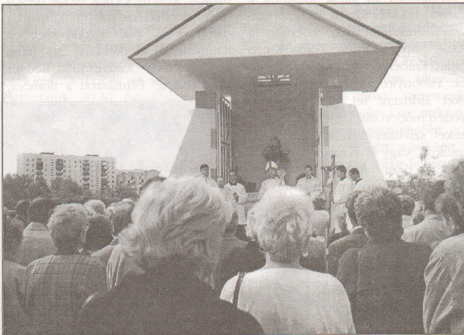
Az ungvári Jézus Szíve-kápolna.

Ungvár nagy kiterjedése miatt szükséges, hogy az új városrészekben is legyen istentiszteleti hely. Ezért az egyházközség kérelmére a város területet adott egy új templom építésére. Ennek első lépése a kis kápolna, melyet június 30-án, Jézus Szíve ünnepén Majnek Antal püspök úr, apostoli adminisztrátor a reggeli szentmisén áldott meg.