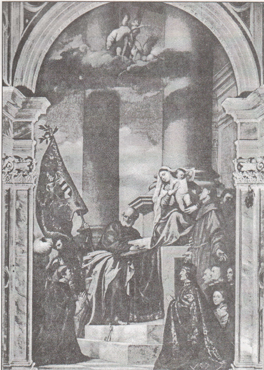
Tiziano: Madonna szentekkel és a Pesaro család tagjaival

A képet egy velencei nemesember, Jacopo Pesaro rendelte a törökök fellett aratott győzelem emlékére, hálaadás céljából. Tiziano a győztest a Szűz előtt térdelve festette meg, egy török foglyot tartó fegyveres zászló-