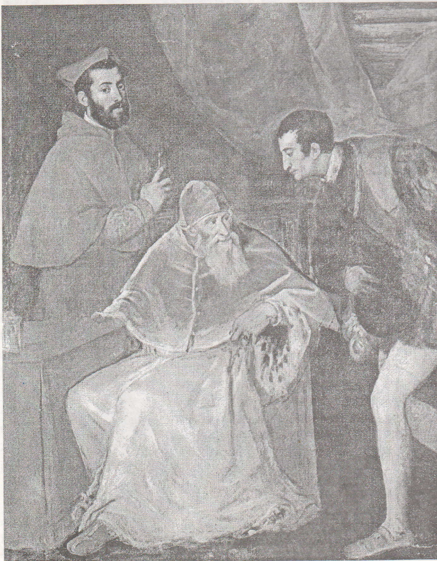
Tiziano: III. Pál pápa Alessandro és Ottavio Farnese társaságában

zó, Nápolyban őrzött kép előtt. Az idős Szentatya egy fiatal rokonához Alessandro Farneséhez fordul, éppen tiszteletét akarja leróni, míg bátyja, Ottavio nyugodtan figyel bennünket. Tiziano minden bizonynyal jól ismerte és nagyra becsülte Raffaello képét, mely X. Leó pápát kardinálisai körében ábrázolja (mintegy 28 évvel korábban készült), ugyanakkor az is valószínű, hogy Tiziano túl akarta szárnyalni példaképét jellemzőerő tekintetében. Valóban, olyannyira meggyőző erejű, drámai e három személyiség találkozására, hogy az ember önkéntelenül is gondolataikat, érzelmeiket kezdi találgatni. A festmény befejezetlen maradt, mert a mester elutazott Rómából, hogy eleget tegyen V. Károly császár Németországba szólító hívásának.