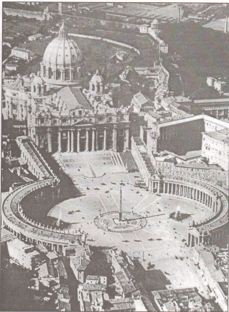
A Szent Péter székesegyház

Bernini a művészet számos területén követendő normákat és mintákat alakított ki. Életében több emlékművet és síremléket is készített. Utóbbiból kettő a pápai székesegyházban áll, és elkészültük óta zarán-