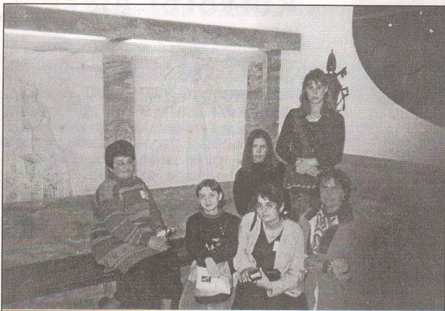
A csoport tagjai Apor Vilmos reliefje előtt